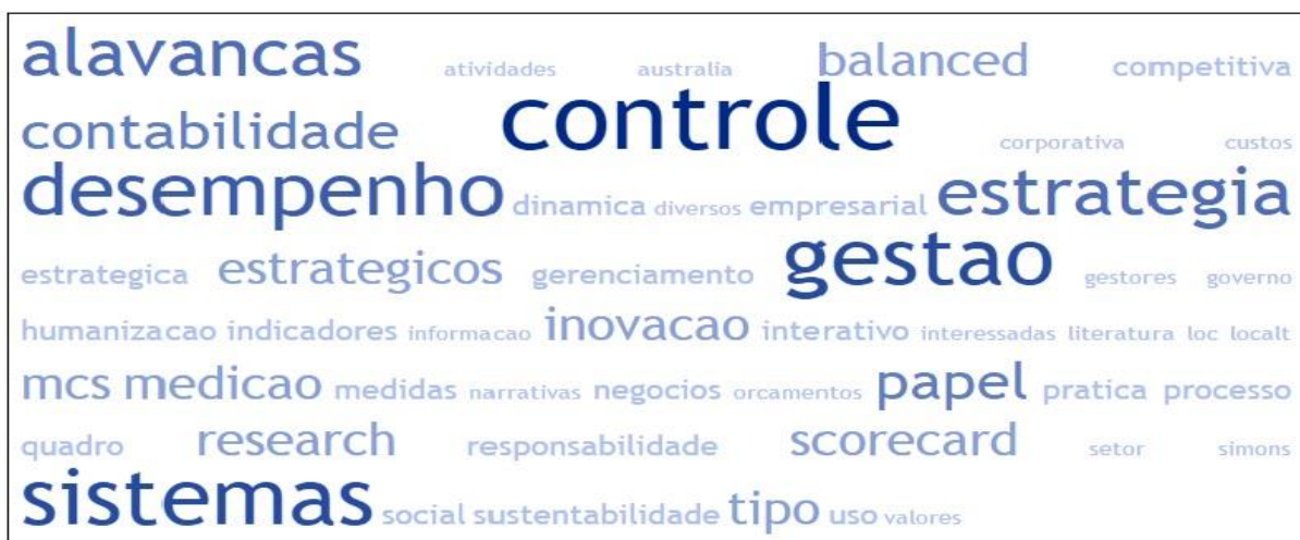
Figura 2 Nuvem de palavras das palavras chaves dos artigos analisado

Com base na nuvem de palavras, verifica-se que as palavras mencionadas com maior frequência nas palavras-chaves foram: alavancas, controle, gestão, sistemas, estratégia, desempenho, contabilidade, inovação, balanced scorecard e medição. Estas palavras demonstram que os estudos sobre as alavancas de controle estão direcionados à gestão, sistemas de controle gerencial, estratégia, inovação e desempenho organizacional. No próximo tópico será abordado as características teóricas dos artigos analisados.